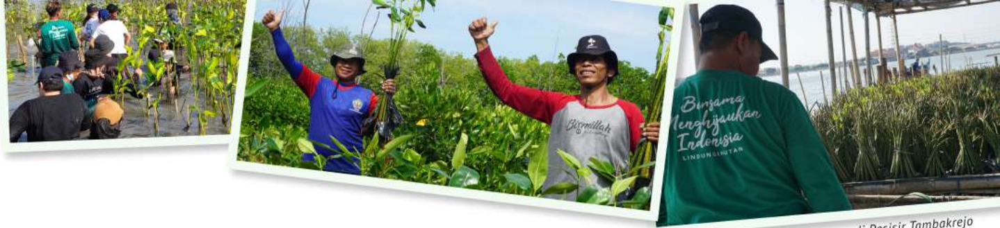
Rumah Pembibitan Mangrove di Pesisir Tambakrejo