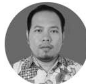
Nasikhul Ulum Programmer