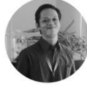
Tri AN Ikhwan Creative Designer